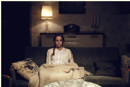
In der Stille der Nacht