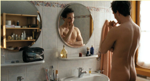
Eisprung mit Papa