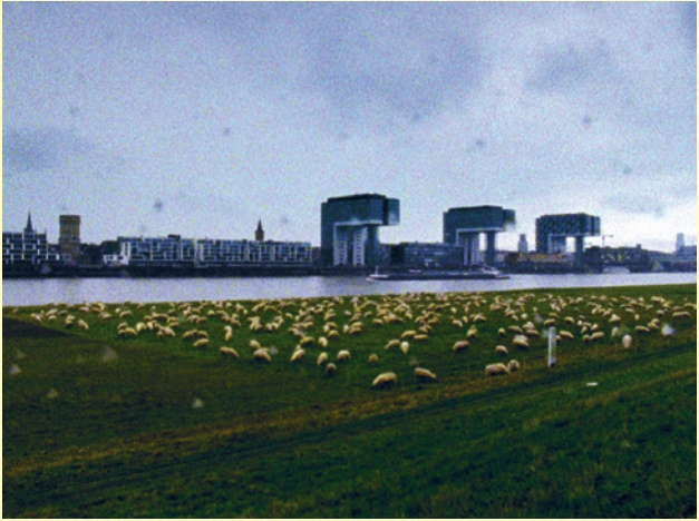
Stadt Land Schaf