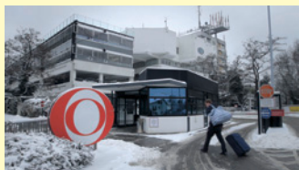
Der Sender schläft