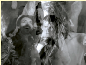
The Two Sisters